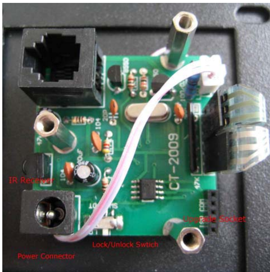
圖 CT-2009 的各接口及插座位置。