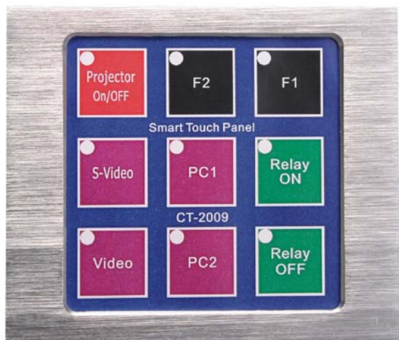
Figure 1. CT-2009 觸控面板正面圖

非常感謝閣下購買了本公司 CT-2009 觸摸式控制面板，為使閣下能快速地使用本產品，使用本產品前，請仔細閱讀本說明書。